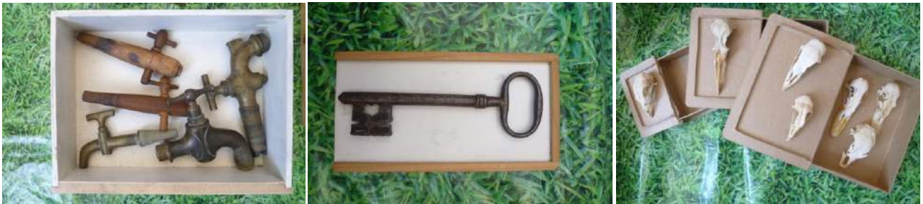
CLEF ROBIN et GAS'LAID MEDUZÉ

(Roland Shön, « Du théâtre par objet interposés »)