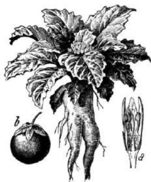
FIG. 1247. - Mandragore. a. Coupe de la fleur; b. Fruit.

Non loin de la source et de l'arbre, cachée sous un coudrier, une mandragore chantait. Toutes les magies rustiques étaient réunies dans ce petit coin de terre.